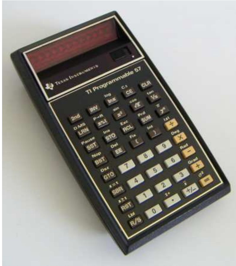
La TI 57